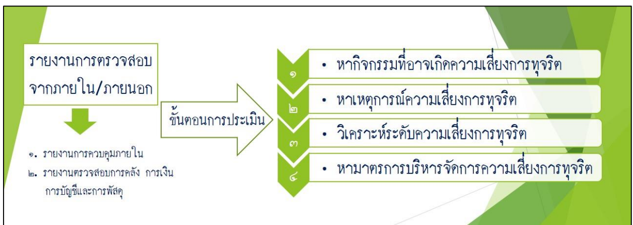
รูปภาพแผนผังขั้นตอนการประเมินความเสี่ยงการทุจริต

ขั้นที่ 4 การหามาตรการบริหารจัดการความเสี่ยงการทุจริต หาแนวทาง/กิจกรรมที่สามารถจัดการความเสี่ยงการทุจริตออกไปให้หมด